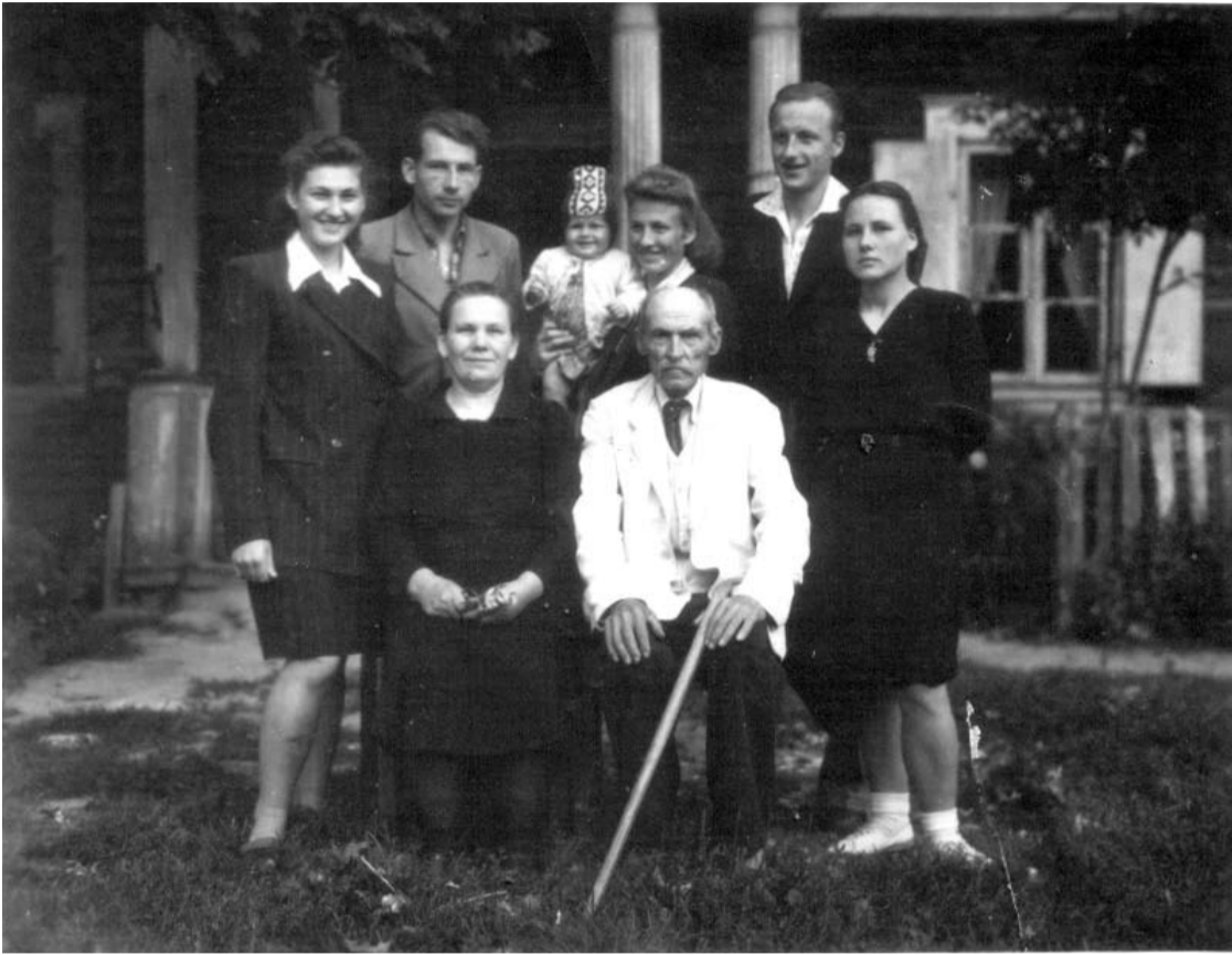
Rudolevičų šeima prie savo namų.