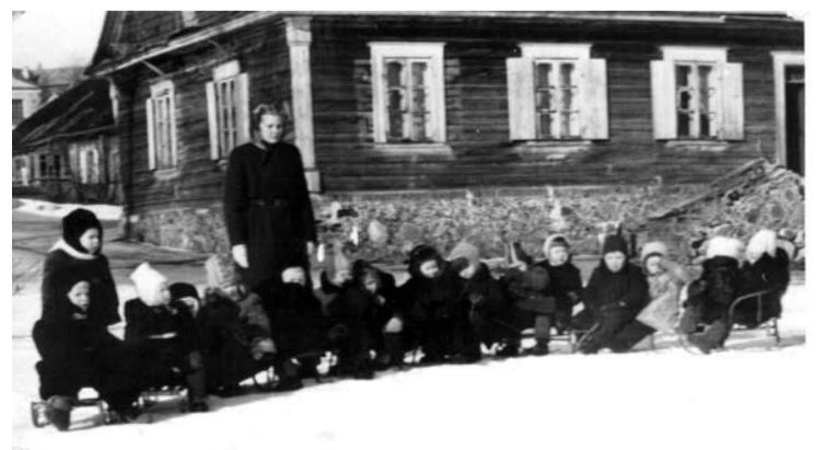
1958m. senajame Rudolevičių name buvo įkurtas vaikų darželis.