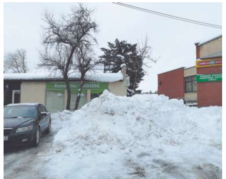
Per parą Anykščiuose iškrito 19 centimetrų sniego.