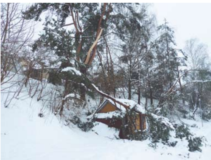
Neatlaiklusios sniego medžių šakos krito ant pastatų.