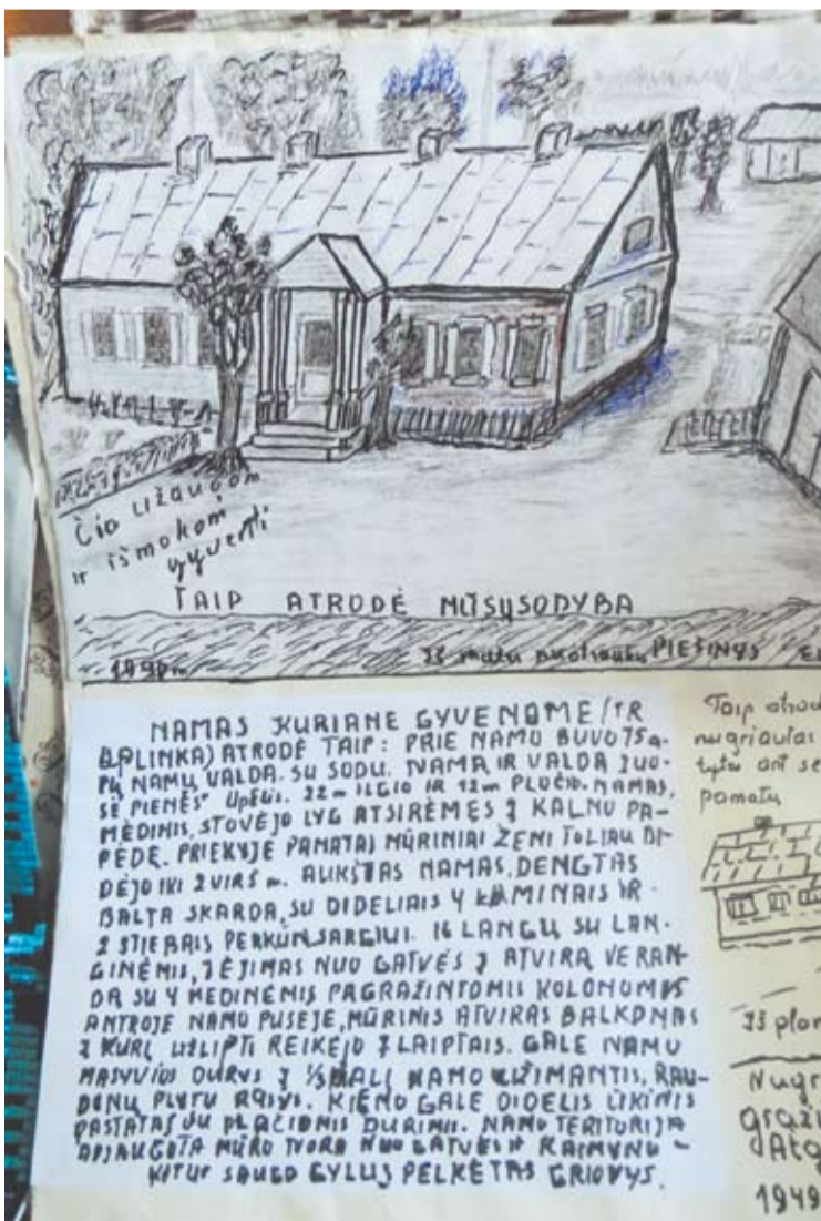
Buvęs nugriautas namas atrodė taip, kaip išpiešė pati Eleonora.