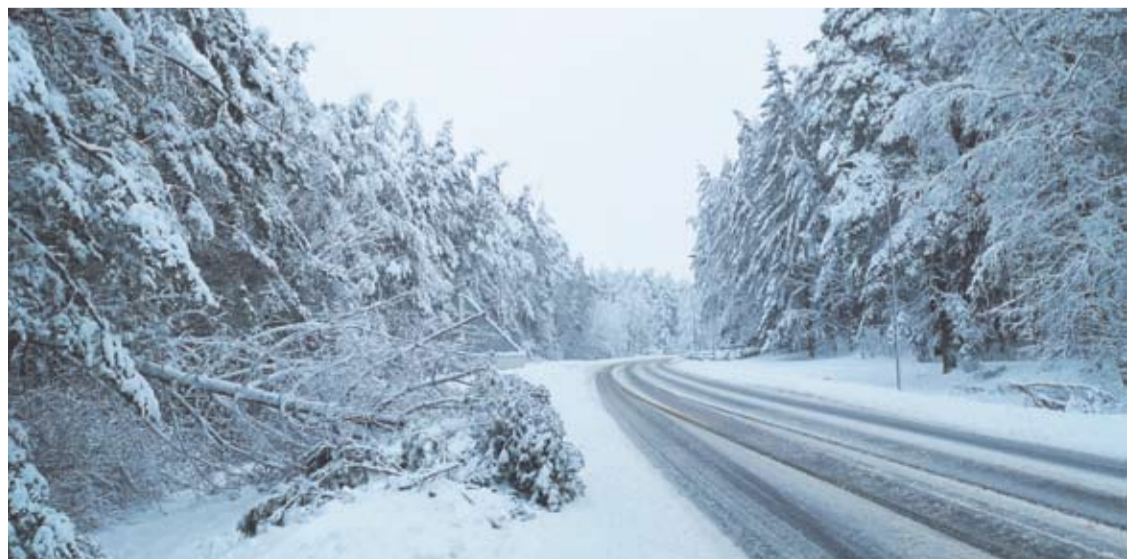
Šiomis dienomis keliai buvo neišvažiuojami.