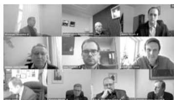
VŠĮ „Aukštaitijos siaurasis geležinkelis“ dalininkų atstovai rinkosi į nuotolinį posėdį.