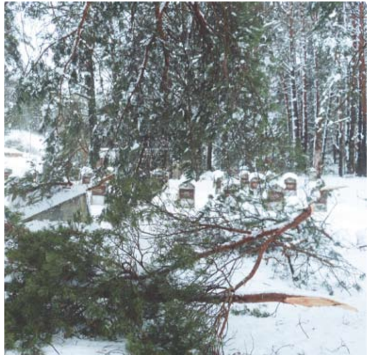
Tarybinių karių kapinės Anykščiuose - lyg po karo.

Sausio 26-28 dienomis elektros tiekimas buvo sutrikęs beveik visiems Anykščių rajono gyventojams. Elektra buvo dingusi ir Anykščių mieste, ir seniūnijų centruose.