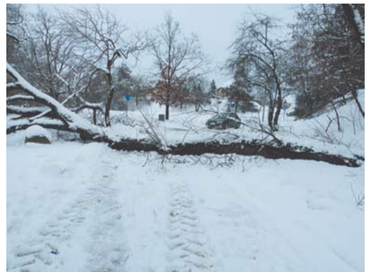
Sniegas išvertė ir neapkabinamus medžius.